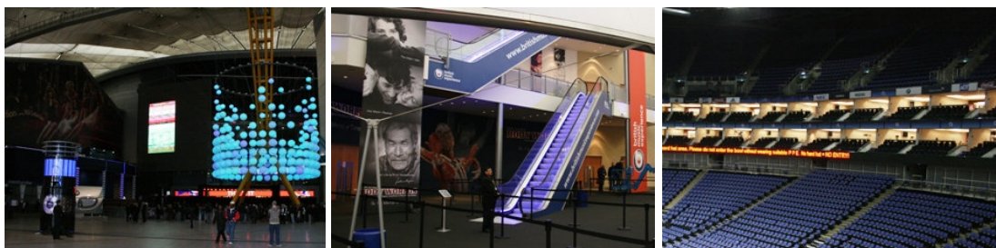
(nelle foto, da sx: l'ingresso; gli accessi interni al Millennium Dome; gli skybox visti dall'interno dell'O2Arena)

C'era una volta solo il Millennium Dome, la struttura avveniristica a pochi passi dal centro di Londra, innalzata per celebrare appunto il nuovo millennio dall'amministrazione locale: arriva poi AEG che dà contenuto a una forma quanto mai suggestiva, trovando una sinergia perfetta con le istituzioni da un lato e con un partner globale (O2, ramo telecomunicazioni) dall'altro. Obiettivo: far diventare il Millennium un contenitore di divertimento a 360° famoso in tutto il mondo, non solo per i 20mila posti che offre in occasione di concerti, eventi sportivi e meeting , quanto per l'incredibile offerta di divertimento (“entertainment”, come sottolinea più volte Kabaznick nella sua esauriente descrizione) che attornia l'impianto, con negozi, ristoranti, bar, sale giochi, una piccola fiera .