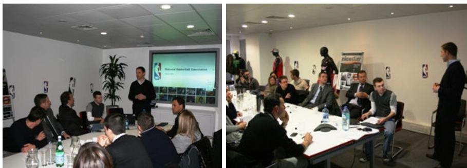
(nelle foto, focus group degli studenti SBS con i manager NBA)

O come dimostrano le iniziative di marketing che NBA opera su tutto il pianeta a differenti livelli, come hanno spiegato i responsabili dei settori comunicazione, media, diritti tv, merchandising e commerciale : interessante la strategia di collaborazione con i partner, per cui non viene stabilita un'esclusiva in base alle categorie merceologiche di appartenenza su scala mondiale, ma a livello territoriale, in modo da poter creare sinergie in parti differenti del pianeta con marchi di aziende competitor tra loro, concetto difficile da capire e applicare a realtà che non siano "globali" come NBA, appunto.